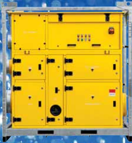
RUIMTEDROGERS Pagina 12