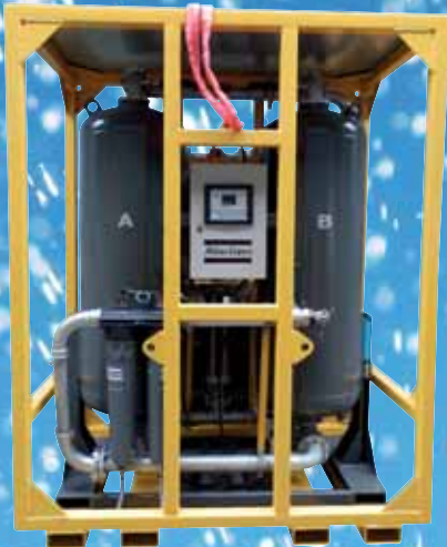
PERSLUCHTADSORPTIEDROGERS Pagina 10